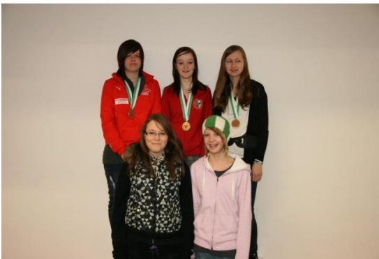
Jugend 2 w