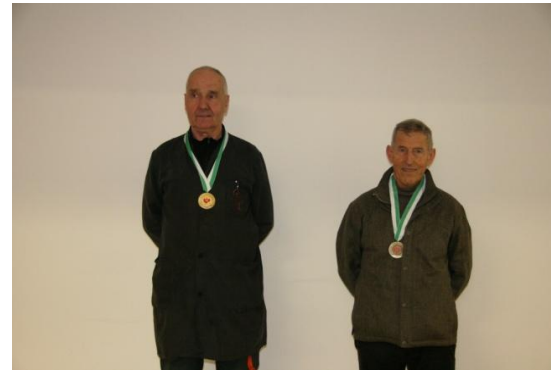
Senioren 3 (stehend frei)