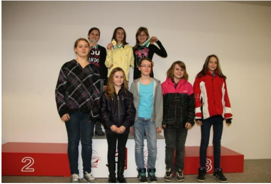
Jugend 1 w