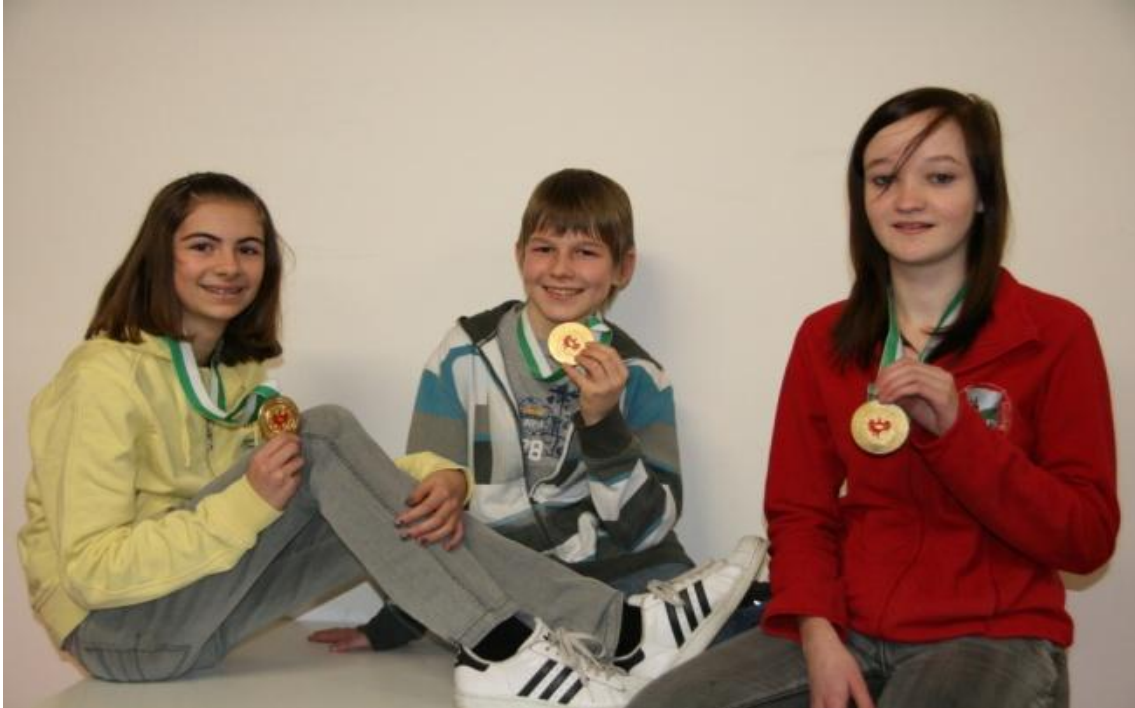
"Glückliche Sieger !"