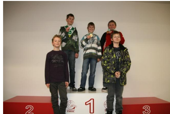
Jugend 1 m