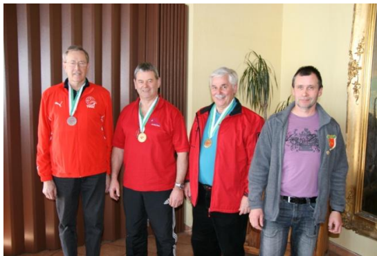
Senioren 2 m