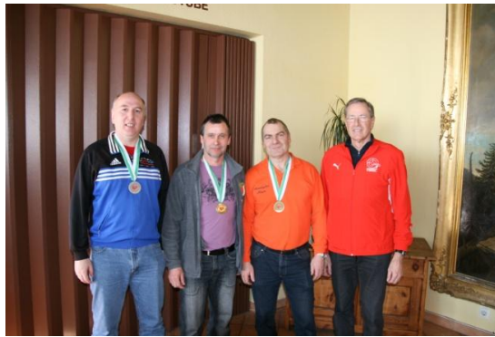
Senioren 1 m