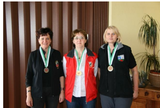
Senioren 1 w