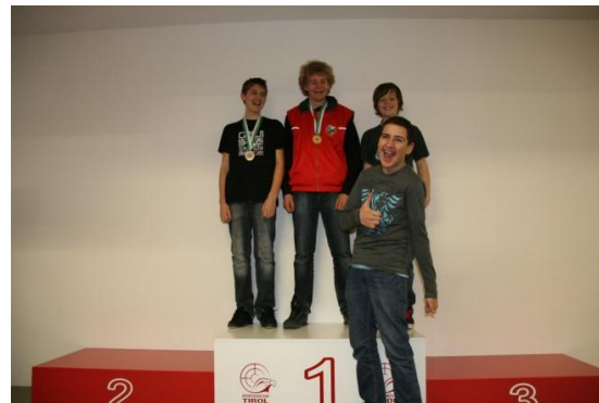
Jugend 2 m